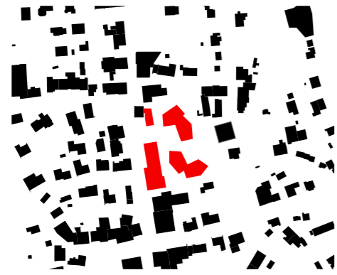
⌚ Schwarzplan 1:5'000

T +41 62 823 25 27 info@husistein.com husistein.com