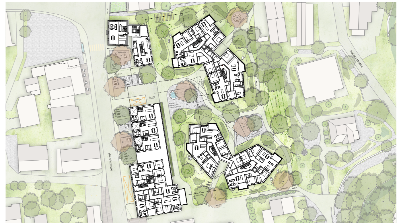
⌚ Situationsplan 1:500

Spezielle Eigenschaft Einordnung in das Orts-, Quartier- und Landschaftsbild sowie hochwertige Freiraumgestaltung mit naturnaher Vernetzung.