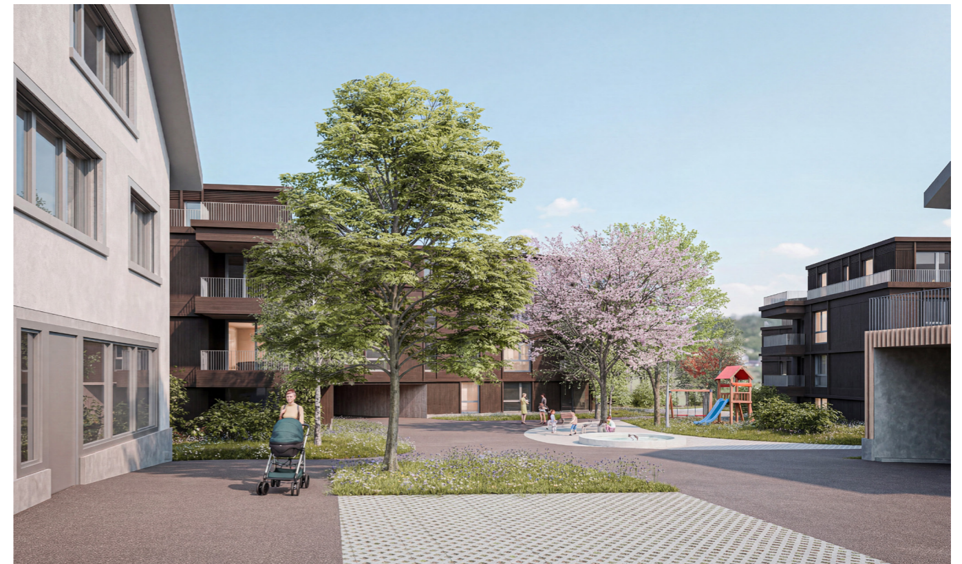
Visualisierung Husistein & Partner