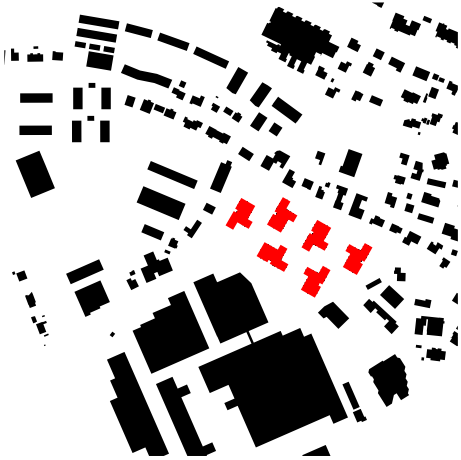
⌚ Schwarzplan 1:8'000

Schachenallee 29 Postfach 5001 Aarau 1 T +41 62 823 25 27 info@husistein.com husistein.com