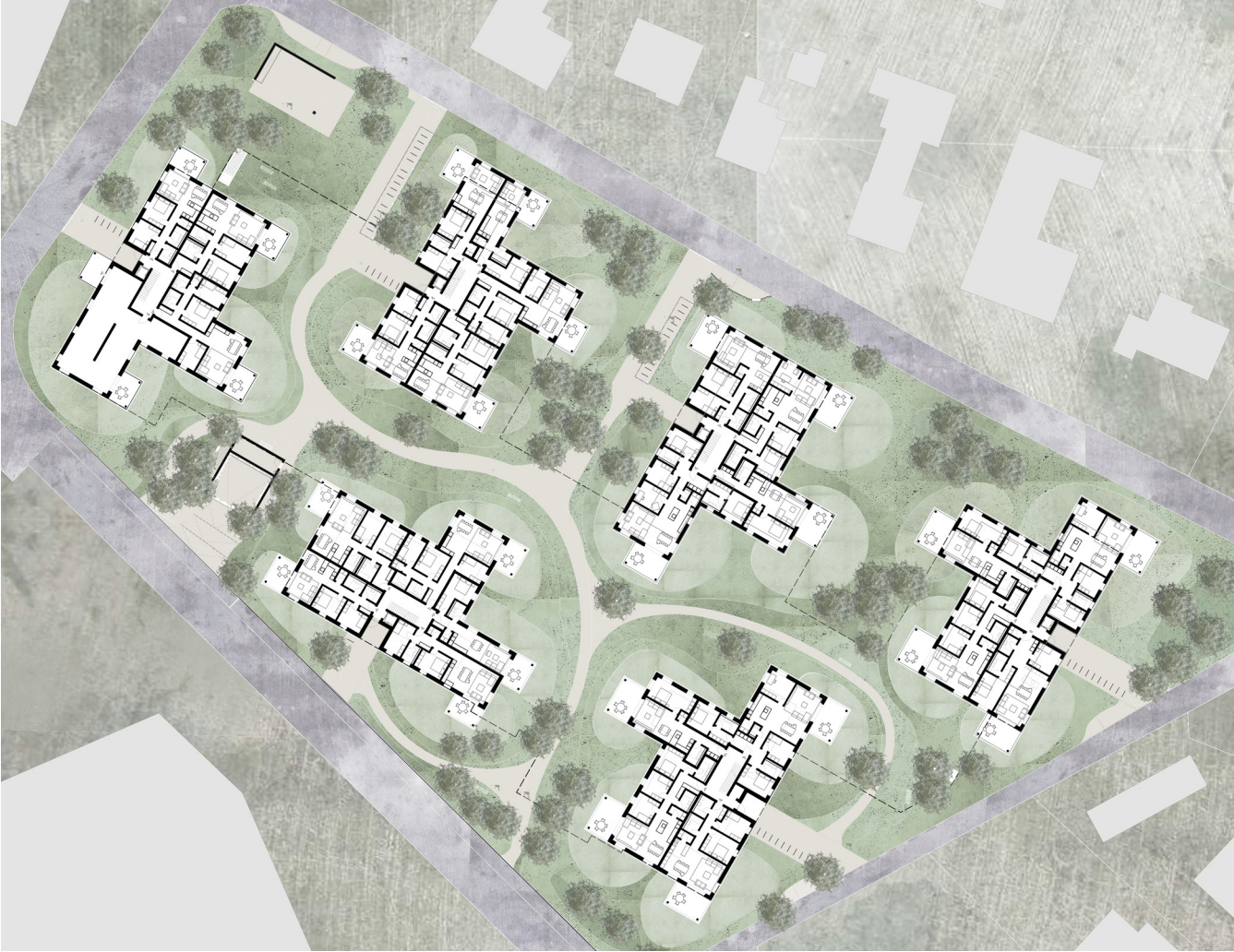
⌚ Umgebungsplan 1:1'000