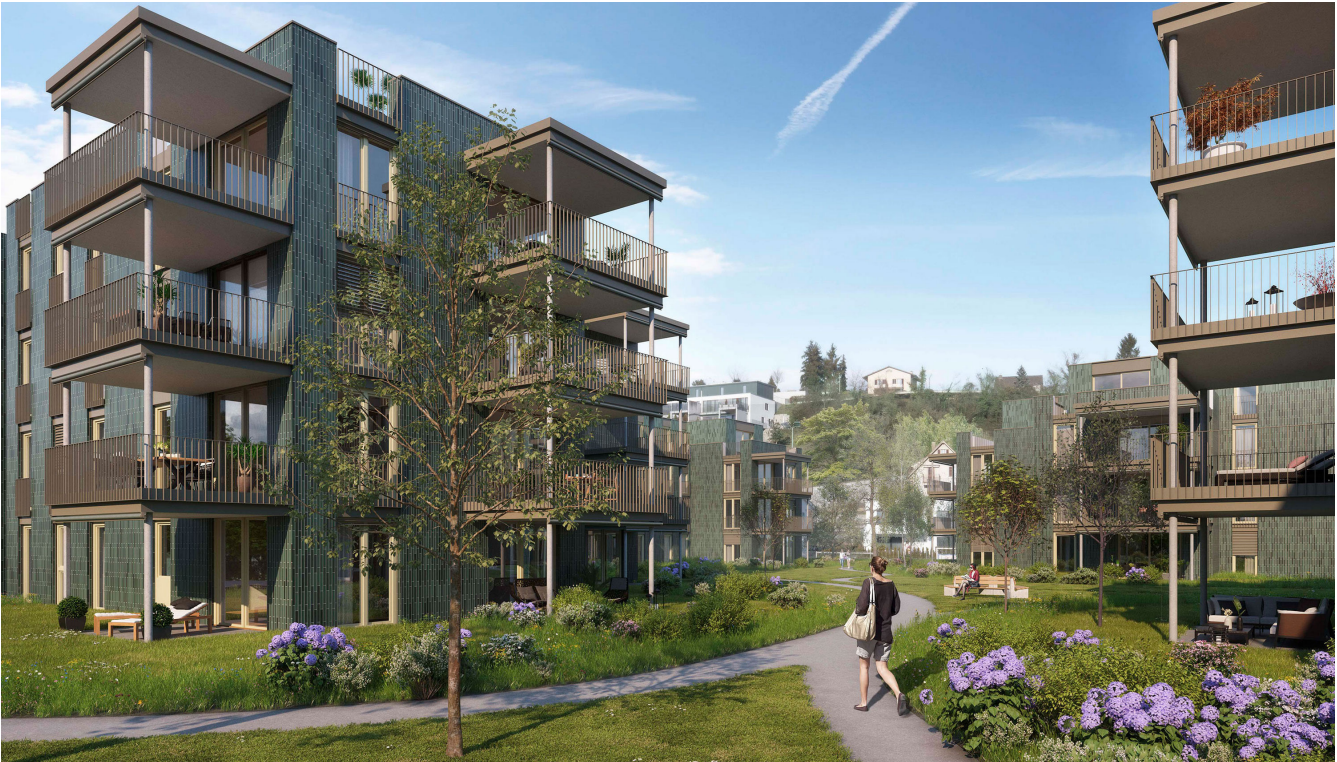
Visualisierung Swiss Interactive AG